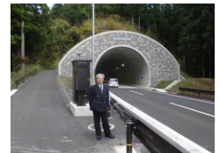
●ホノケ山トンネル

●台風 18 号の被害視察や昭和 38 年から延々と続く海岸防災林事業、中部縦貫自動車道工事、ホノケ山トンネルなどを視察し、工事の完成度や安全性をチェックしました。