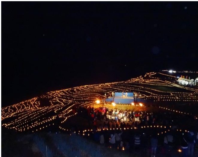
●国指定文化財名勝「白米千枚田」の幻想的風景、 観光客入込数 約 25 万人