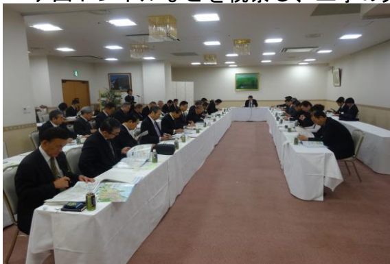
●京都府議会の自民党議員団と自民党県政会との「北陸新幹線についての意見交換会」がアオッサで開かれました。災害時における複数の交通ネットワークの確保と、北陸 3 県の背後にある 600 万人との交流を大切にすべきと訴えました。

●台風 18 号の被害視察や昭和 38 年から延々と続く海岸防災林事業、中部縦貫自動車道工事、ホノケ山トンネルなどを視察し、工事の完成度や安全性をチェックしました。