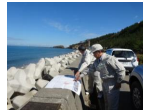
●海岸防災林事業、 50年かかりそう！