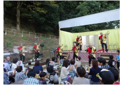
●「第7回スコップ三味線世界大会」 で優勝した「七瀬スコッパーズ」の 演奏風景(南檜原町)