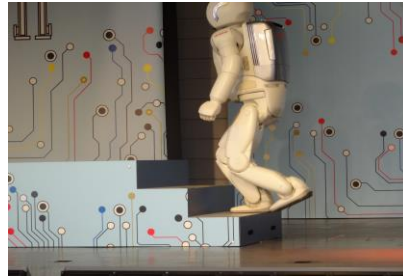
●すごい！階段を上るアシモ君！ ロボット技術は、日進月歩