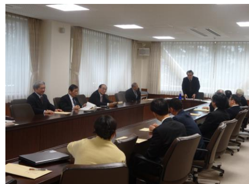
●北陸農政局からの農地中間管理機構についての説明。平たん部だけの事業になったり、集落が崩壊しないよう対策を講ずる必要あり！