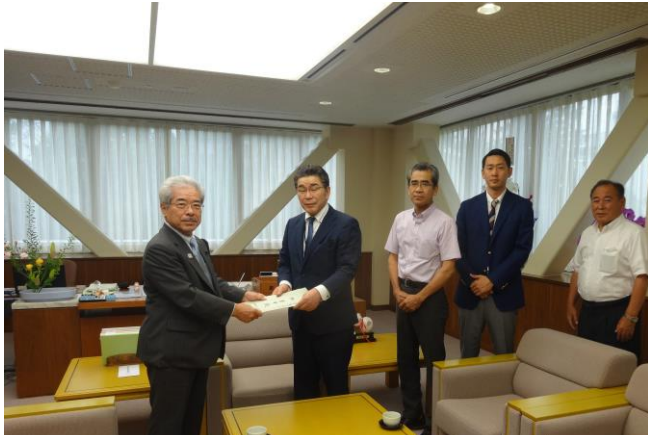
●7/6 福井市旅館業組合よりの陳情受付