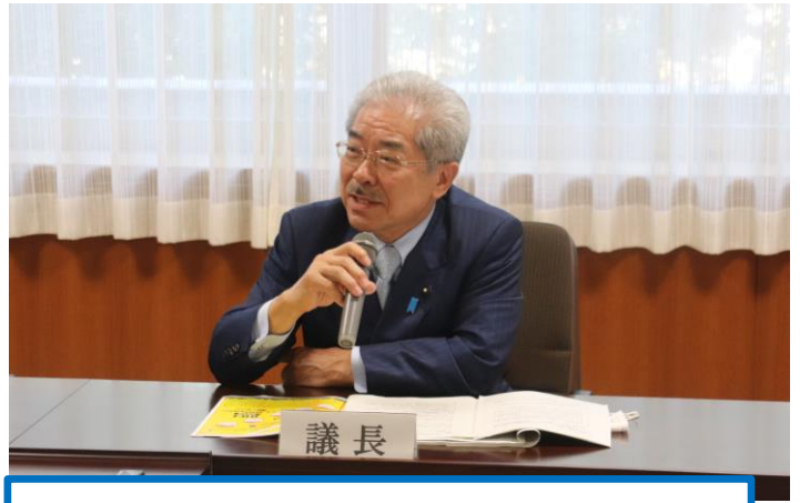
●6/16 議長就任における記者会見の様子