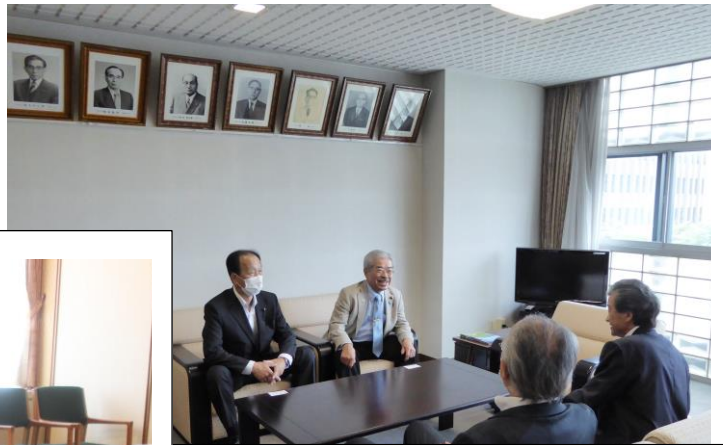
●6/18 福井県商工会連合会との意見交換