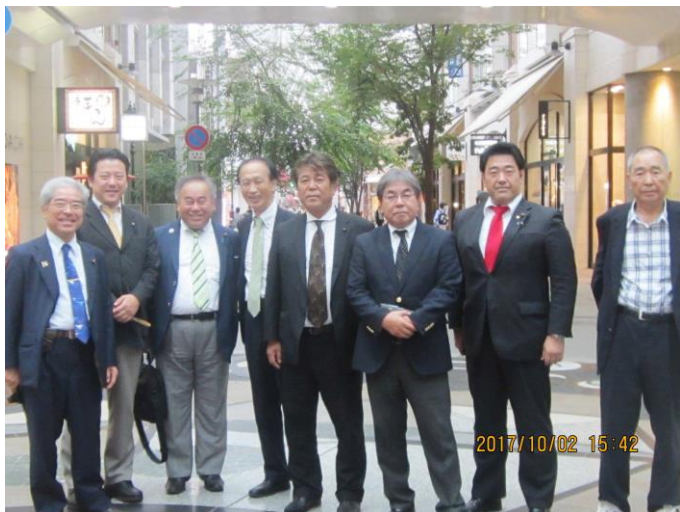
●10/3 400年以上の歴史を持つ香川県の高松丸亀商店街。 大変な賑わいがあり、『土地の利用と分離』が商店街の 再開発を後押しした模様！