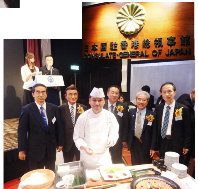
●11/16 食文化商談会 (香港) 昨年に引き続き、香港で食文化商談会を開催。若狭塗り 箸、みそ、うに、お酒、『いちほまれ』から『極(越前ガニ)』 まで紹介。日本国駐香港総領事館も訪ねました。