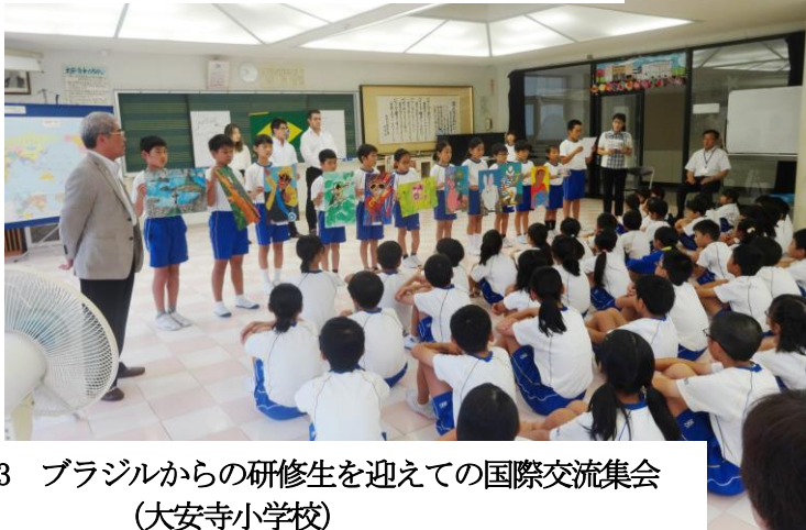
●9/3 ブラジルからの研修生を迎えての国際交流集会 (大安寺小学校)