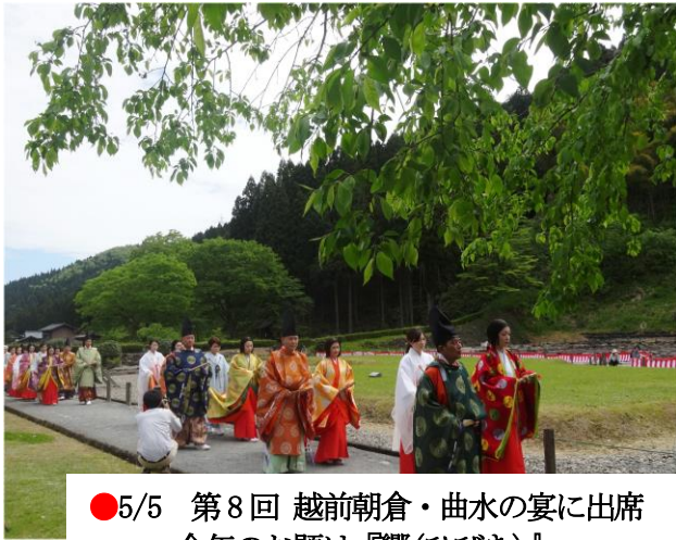
●5/5 第8回 越前朝倉・曲水の宴に出席 今年のお題は『響(ひびき)』