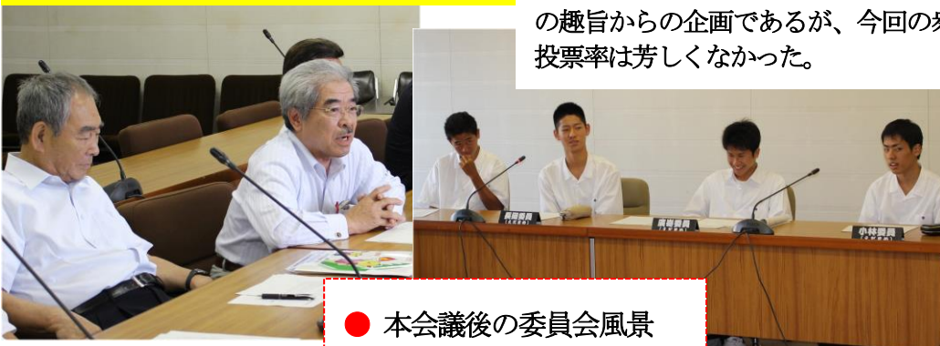
● 本会議後の委員会風景

昨年 7 月に行われた参議院議員選挙以降、選挙権年齢が満 18 歳以上に引き下げられた。若者の声を政治に反映させたい、活かしたいとの趣旨からの企画であるが、今回の衆議院議員選挙 (10/22) では、投票率は芳しくなかった。